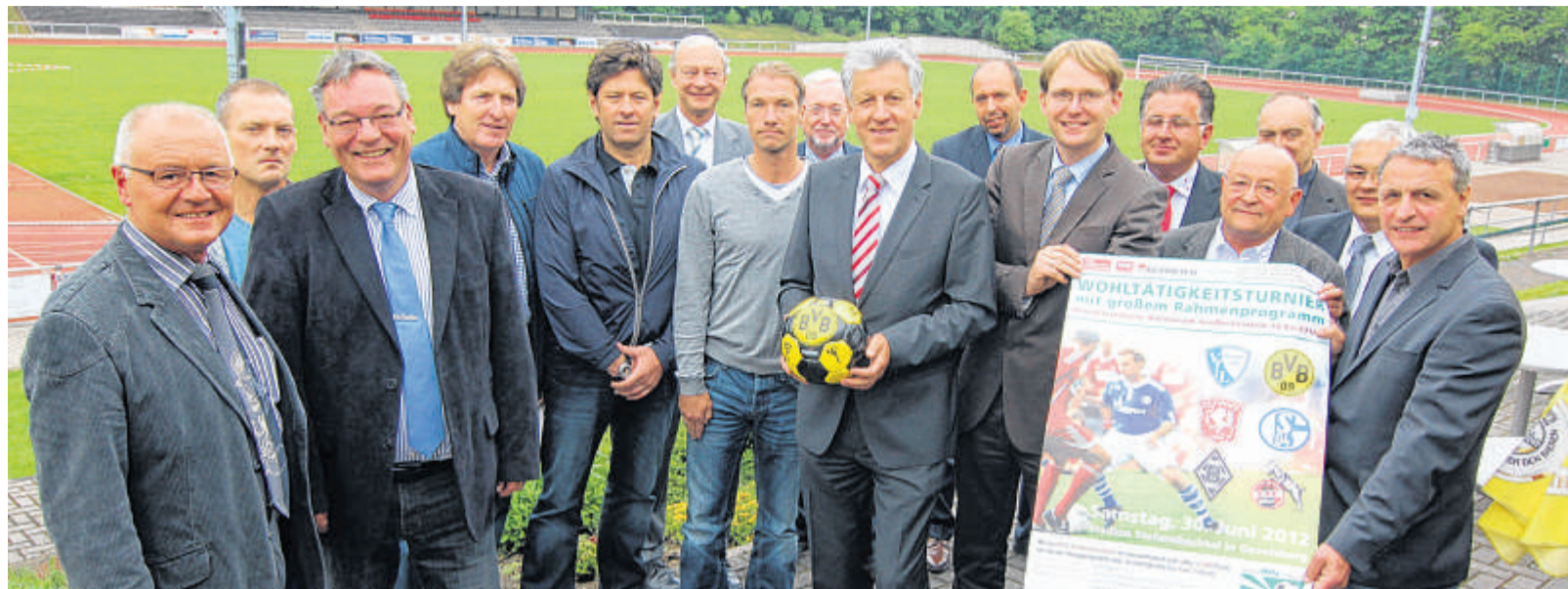
Viel Prominenz war zur Vorstellung der zweiten Ausgabe des Oldstar-Cups gekommen.